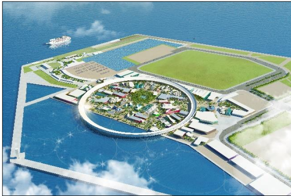
夢洲に造られる万博会場イメージ